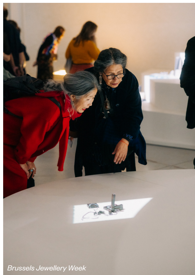
Brussels Jewellery Week

Au total, 153 créateur-ice-s bruxellois-e-s et belges ont été mis-e-s en lumière à travers ces expositions, attirant 8.918 visiteur-euse-s et générant 92 publications presse dédiées à ces événements.