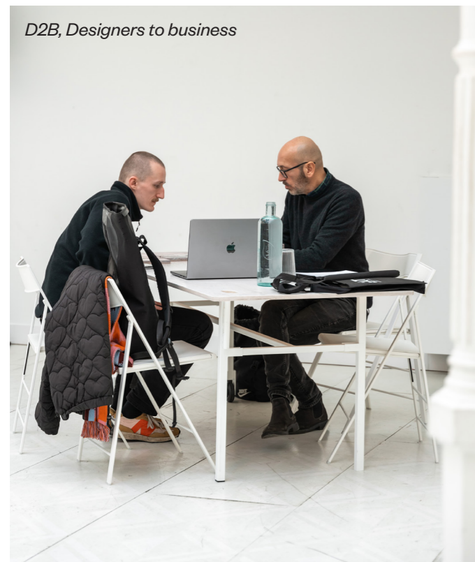
D2B, Designers to business

A travers ces objectifs, le MAD s'engage à inspirer les créatif-ve-s en leur offrant un accès privilégié à des ressources et à des opportunités de formation, de développement et de réseau. Il œuvre également à connecter ces créatif-ve-s au secteur économique en facilitant des collaborations et des partenariats, tout en les accompagnant dans leur projet entrepreneurial. Enfin, le MAD guide ces créatif-ve-s tout au long de leur parcours, en les aidant à se faire connaître et à se positionner sur la scène nationale et internationale. Il veille également à entretenir des relations solides avec les acteur-ice-s public-que-s et privé-e-s du secteur de la mode et du design à Bruxelles. En somme, la stratégie Inspire, Connect & Guide vise à consolider la position de Bruxelles en tant que ville créative et à mettre en lumière les talents novateurs des créateur-ice-s bruxellois-e-s dans le monde de la mode et du design.