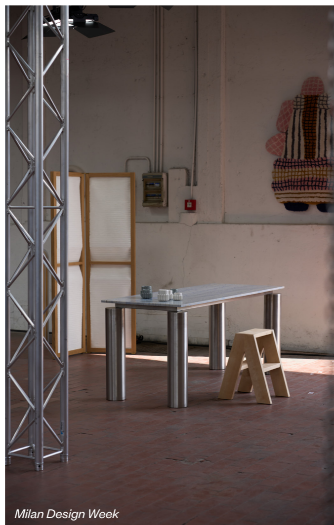
Milan Design Week